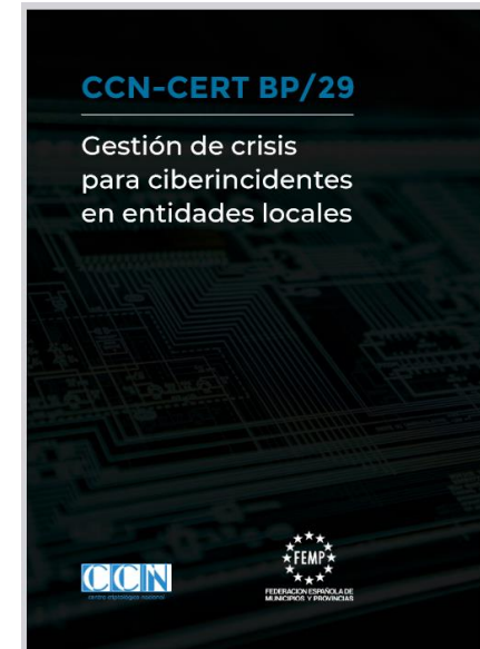
BP/29 - Gestión de crisis para ciberincidentes en entidades locales