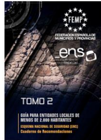
Tomo 2 - Guía para entidades locales de menos de 2.000 habitantes