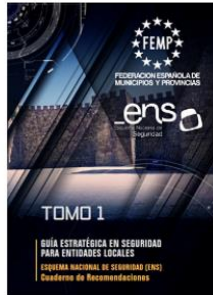
Tomo 1 - Guía estratégica en seguridad para entidades locales