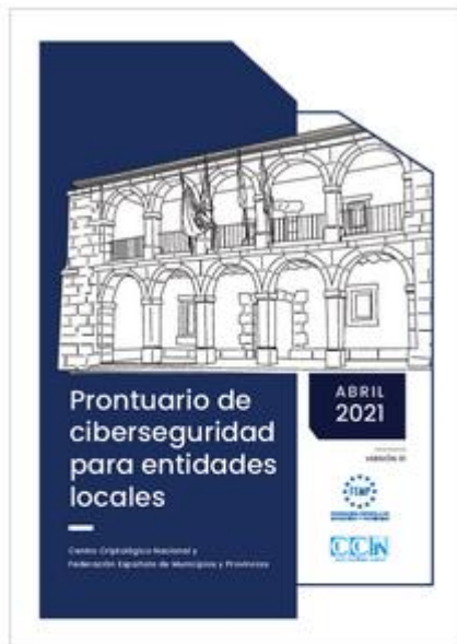
Prontuario de ciberseguridad para entidades locales