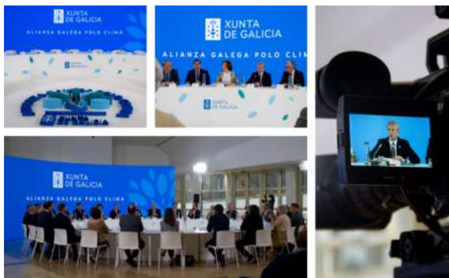
ilustración2. Fotos Acto firmado por la Alianza Galega por el Clima

También se destacó la oportunidad que presentan los fondos europeos Next Generation EU, para consolidar y promover iniciativas innovadoras como el proyecto gallego de desarrollo de fibras textiles a partir de la madera.