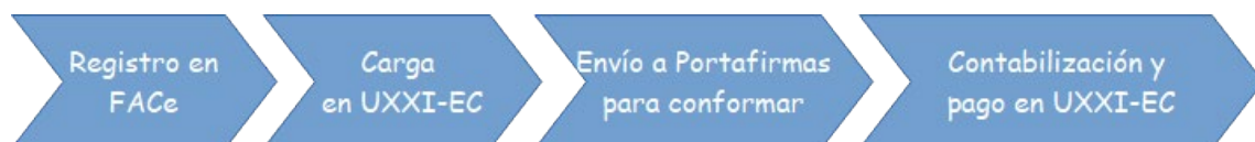
Figura 4 Flujo del proceso de facturas electrónicas