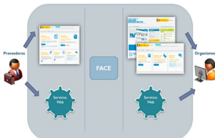
Figura 1 Integraciones con FACE.

Las facturas recibidas en FACe destinadas a la UBU se cargan de forma automática (a demanda de los gestores) en el ERP Universitas XXI-Económico que utiliza la Universidad, evitando de este modo tener que teclear los datos de la factura, ya que se extraen directamente del formato Facturae.